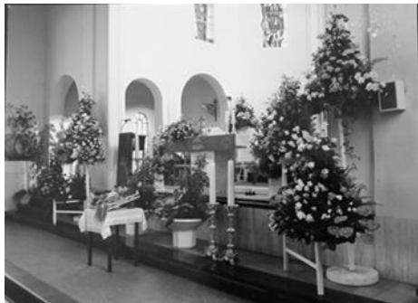
Foto's van een oogstdankviering