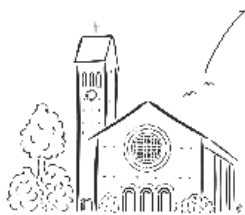
R.K. Parochie D.L. Vrouw van de Berg Karmel Aalsmeer