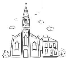
R.K. Parochie St. Jan Geboortekudelsaart