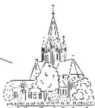
R.K. Parochie St. Libanus Nes aan de Amstel