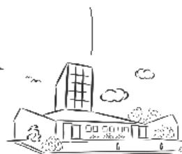
R.K. Parochie St. Jans Geboorte De Kwakel